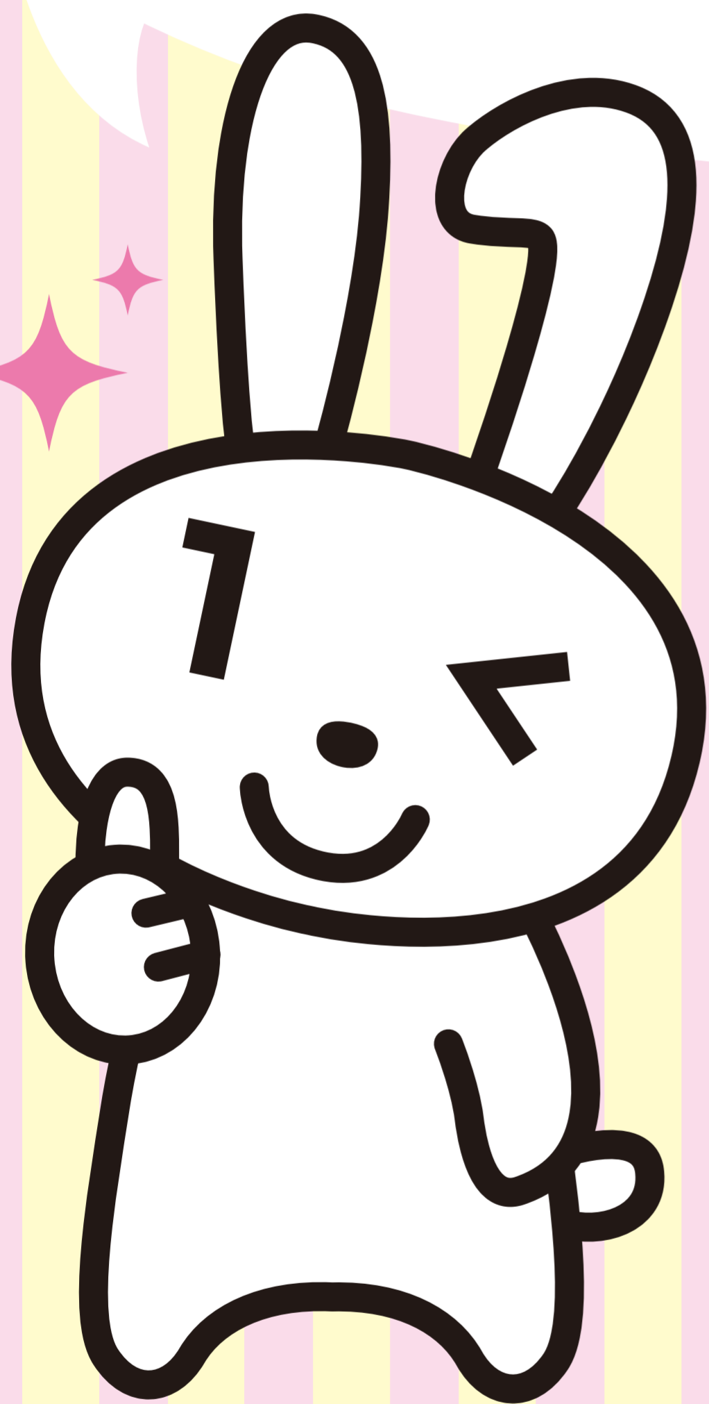
マイナンバーPRキャラクター マイナちゃん